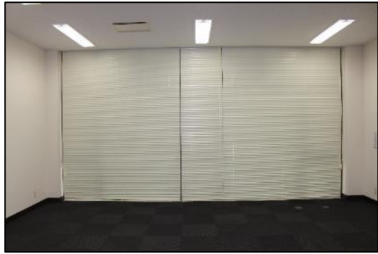
(3) 中核機能支援施設 111 号室