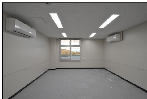
(4) 203号室 (多目的室)