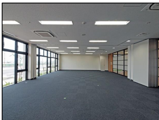
A 棟 108・109 号室内