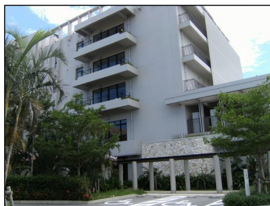
中核機能支援施設 B 棟