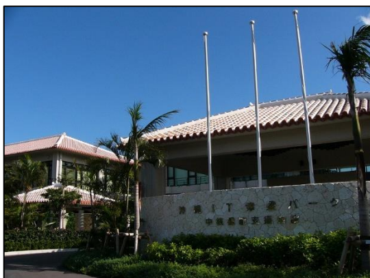
中核機能支援施設 A 棟