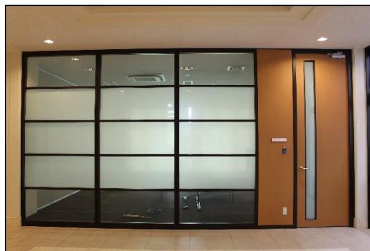
A 棟 109 号室入口