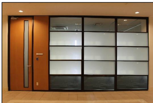
A 棟 108 号室入口